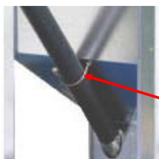
Nosilec transportnega polža (U objemka)

1. Namestite nosilec (U-objemka) transportnega polža v dve luknji na stranski plošči, tako, da bo po ena matica na vsaki strani plošče. Matici trdno privijte. Naravnajte dimenzijo med nosilcem in ploščo tako, da bo ustrezala premeru transportnega polža.